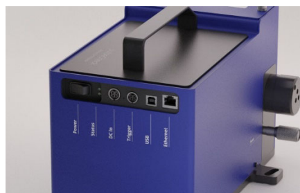
USB, Ethernet 接続からリモート制御可能